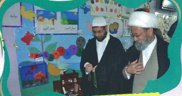
وفد من دار القرآن الكريم يزور معرض روضة الإمام الحسين عليه السلام القرآنية

جعل الله الكعبة آية والمرام قياماً للناس