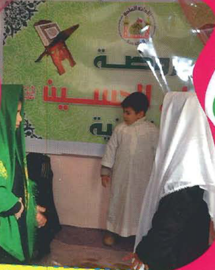
مشهد تمثيلي يجسد موقف الإمام السجاد عليه السلام مع الصحابي الجليل جابر بن عبد الله الأنصاري (رضي الله عنه)