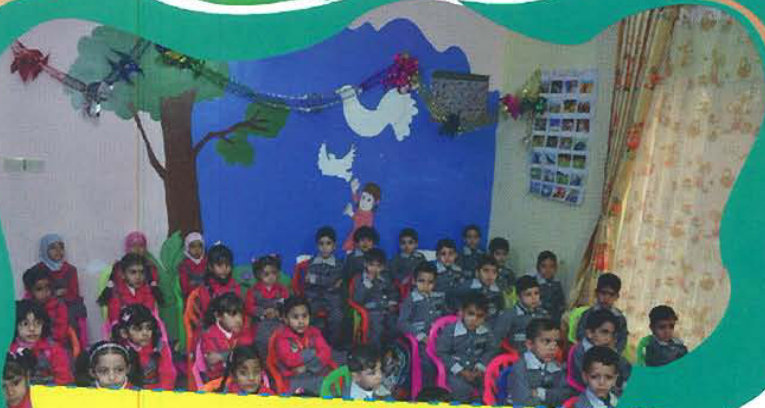
أطفال روضة الإمام الحسين عليه السلام القرآنية بزيهم الجديد