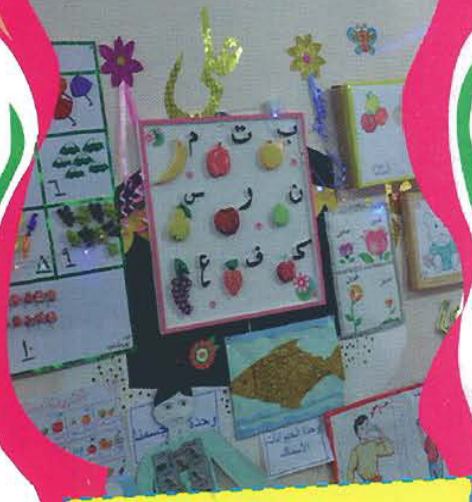
جانب من معرض روضة الإمام الحسين عليه السلام القرآنية

جعل الله الكعبة آية والمرام قياماً للناس